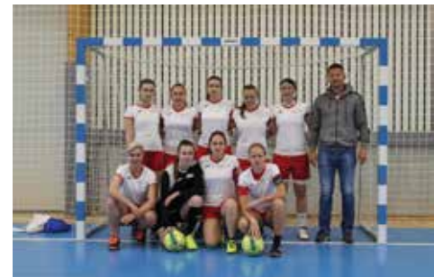
Naš ponos, nogometašice SŠSB z osvojenim 4. mestom v finalu tekmovanja za srednje šole