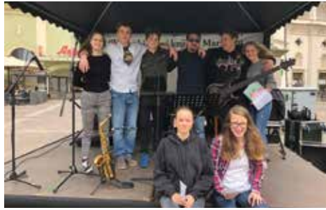
Ko te napiše knjiga, udeleženci literarno-glasbenega maratona