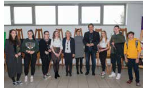
Naše umetniške duše, nagrajenci likovne razstave ob 20-letnici šole