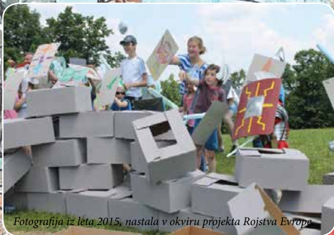
Fotografija iz leta 2015, nastala v okviru projekta Rojstva Evrope

KJE? Arheološko najdišče Ančnikovo gradišče pri Jurišni vasi. KDAJ? V soboto, 22. junija 2019, od 10. do 14. ure.