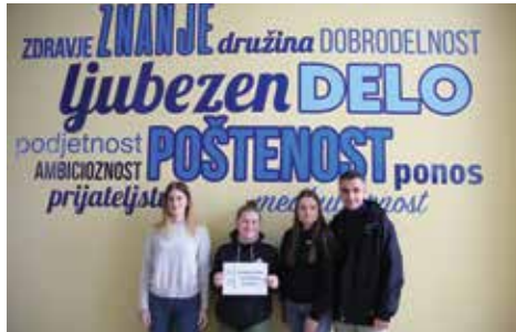
Srečanje ekonomskih šol, ekonomijada, slogani, ki v življenju štejejo