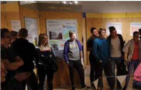
Dijaki na festivalu znanosti Fakultete za kemijo in fiziko v Ljubljani