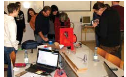
Izobraževanje za učitelje in učence (projekt Širimo obzorja)