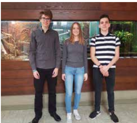
Zlati raziskovalci na regijskem srečanju raziskovalcev Zgornjega Podravja