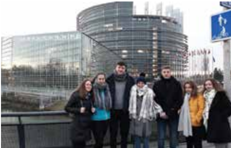
Evrošola v Strasbourgu