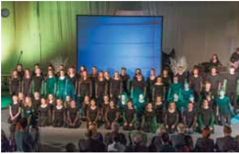
Pevski zbor na Akademiji 20