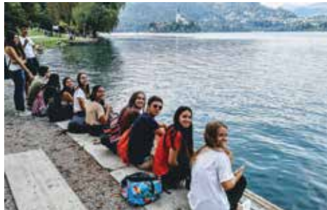
Izmenjava s Španci na Bledu